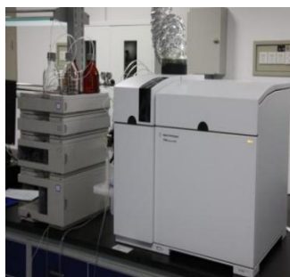
电感耦合等离子质谱仪