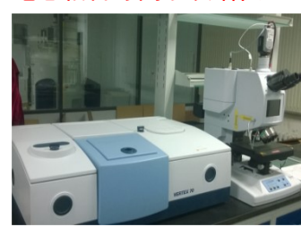
红外光谱仪-红外显微镜